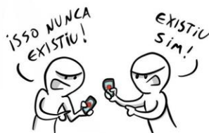
Figura 1: Fonte: Um sábado qualquer